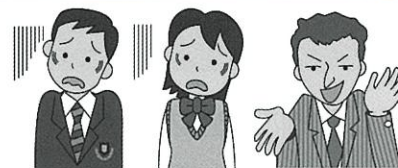
消費者庁イラスト集より