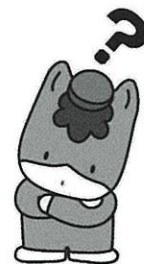
群馬県のマスコット 「ぐんまちゃん」